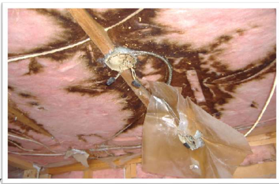
Dommages causés par la fumée résultant du projet d'une habitation après 10 ans de tabagisme intense.

Le tabagisme demeure la principale cause d'incendies résidentiels mortels en Ontario v . La Société des services de logement rapporte qu'en 2013, 21 % des incendies dans des propriétés couvertes par son programme d'assurance collective étaient attribuables à la cigarette, et les dommages s'élevaient à deux millions de dollars. En éliminant la présence à l'intérieur de cigarettes ou de cigares allumés, on réduit le risque d'incendie, de dommages causés par le feu et l'eau, et de blessures ou de décès. Lorsque le fournisseur de logements remplit sa demande d'assurance de la Société des services de logement, il doit indiquer s'il a